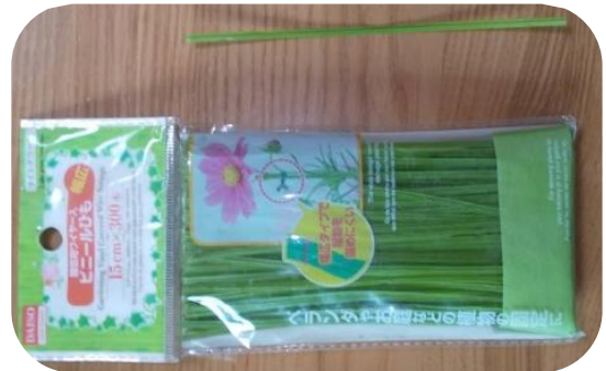
↑写真は園芸用ワイヤー